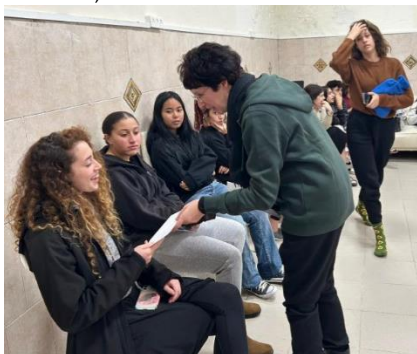
50 meiden uit het meisjeshuis uit Sa'ad werden geëvacueerd

De organisatie die we al jarenlang steunen, heeft een noodfonds opgericht en de medewerkers blijven fysiek en telefonisch in contact met alle betrokkenen bij de verschillende projecten. De inwoners (die de aanslagen overleefd hebben) aan de grens met Gaza waar Yad L'Ami vele projecten heeft, zoals therapeutische hulp voor jonge kinderen, tieners en jonge gezinnen, zijn geëvacueerd naar verschillende plaatsen in Israël.). Zoveel mogelijk worden deze mensen op hun tijdelijke verblijfplaats bezocht. Ook de steeds ouder wordende groep Holocaust overlevenden is uiterst kwetsbaar. Velen vereenzamen en kijken uit naar de bezoeken en hulp van medewerkers van Yad L'Ami ( www.yadlami.com )