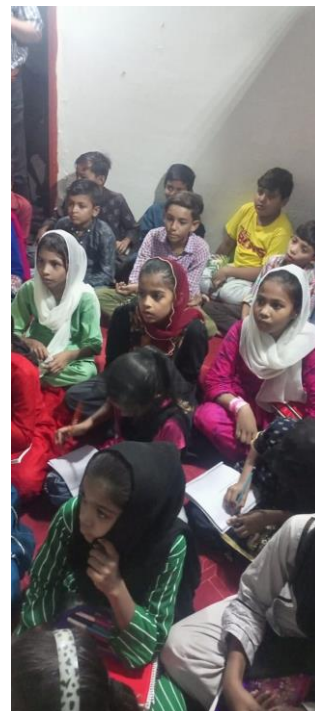
studenten van de bijbelschool