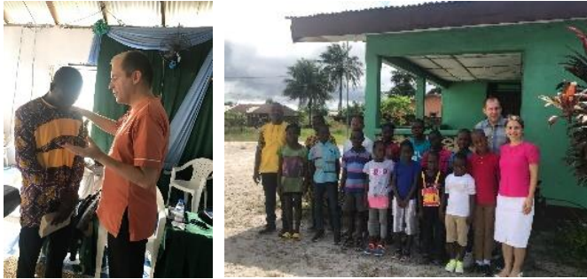
Het werk in Liberia

Terwijl we veel kostbare, bemoedigende berichten en gebedsondersteuning ontvingen (na het verzenden van de vorige nieuwsbrief), ontvingen onze Liberiaanse collega's veel negatieve en beledigende berichten omdat ze met blanke mensen werken. Er was veel pijn en teleurstelling, geestelijke aanvallen en slapeloze nachten. Hoewel het onderzoek ons ervan weerhield om de nieuwe DTS (Discipelschap Training School) te starten, konden we voelen dat zelfs wij als team er niet op voorbereid waren. Daarom zijn we een paar weken bij elkaar gekomen om te bidden, te vasten, elkaar te sterken en ons beter voor te bereiden op de nieuwe DTS. We ontwikkelden samen een gedragscode en we besloten om op 26 november te beginnen met de nieuwe DTS, biddend dat op dat moment alle spanningen met de presidentsverkiezingen voorbij zullen zijn!