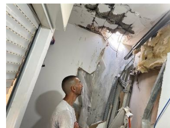
Praktisch hulp na raketinslagen aan de grens met Gaza