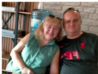
Echtpaar uit Nahariya