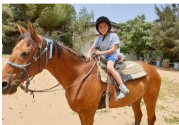
Therapie met paarden en honden Voor getraumatiseerde kinderen

Yad L'Ami voorziet in therapeutische hulp voor jonge kinderen, tieners en jonge gezinnen.