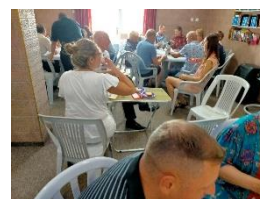
De groep uit Letland