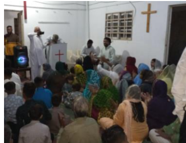
Bijeenkomst van de gemeente in Karchi