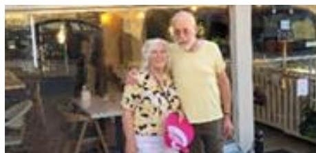
In de stad zelf