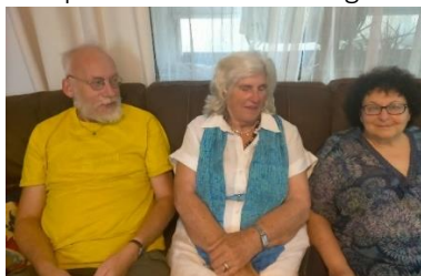
Bij Elana in Katsrin

Er is ook een bezoek gebracht aan echtpaar in Nahariya waarmee samen gepraat en gebeden is. Dit echtpaar heeft een verlangen in hun hart om in de toekomst een huis van Gebed te starten.