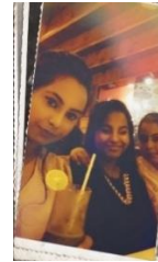
Pastor en zijn kinderen